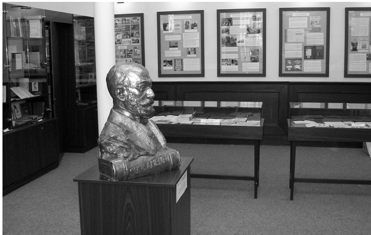
La salono en la Esperanto-Muzeo kun la busto de Zamenhof