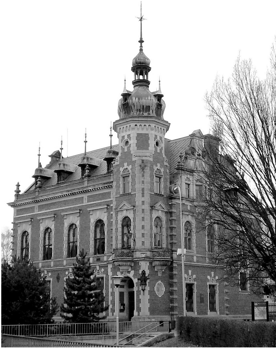
La Ottendorfer-biblioteko en Svitavy kun la Esperanto-Muzeo